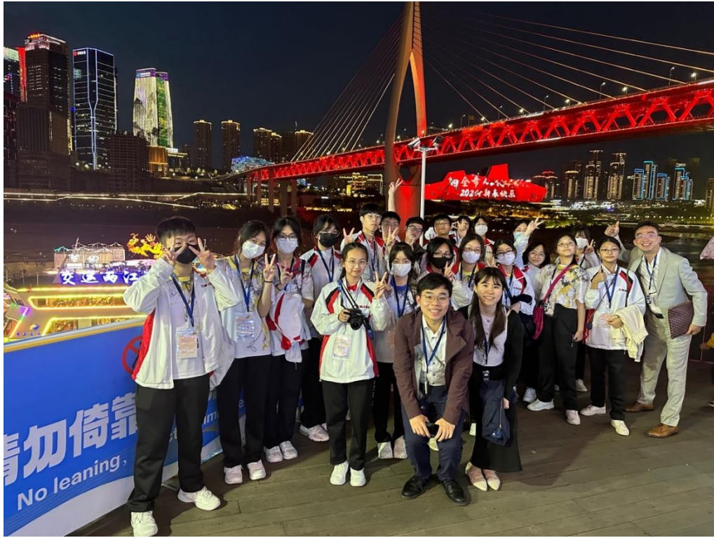
师生畅游长江，感受巴山渝水的美丽风光，体验祖国经济及基础建设的飞速发展