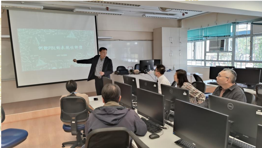
内地专家教师与本校教师交流 STEAM 教育学习评估