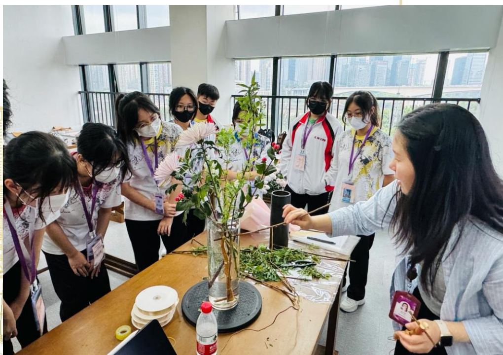
学生在重庆巴蜀中学跟当地老师学习插花艺术，亲身体会内地学校特色课程

其次，人力资源和参与人数方面存在限制。除了升旗仪式和公民与社会发展科的内地考察之外，许多体验式学习活动都有参与人数的限制及学生的积极性。例如，在中华文化周期间，即使有很多学生感兴趣，也需要教师多加点拨指正，否则可能会影响活动的效果。另外，许多体验式学习活动需要较高的师生比例。例如，带领 20 名以上的学生到内地交流就需要约三名教师。由于学校的人力资源有限，需要平衡教师在其他领域的工作量，因此组织大量体验式学习活动的的能力有限，也阻碍了体验式学习的广泛实施。